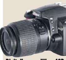
Digitalkamera Nikon 40D