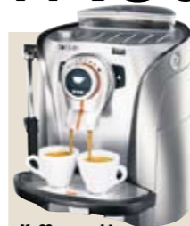
Kaffeemaschine Saeco Odea Giro Plus