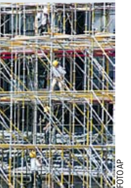
Rentenalter 60: Auf dem Bau bereits erstritten.