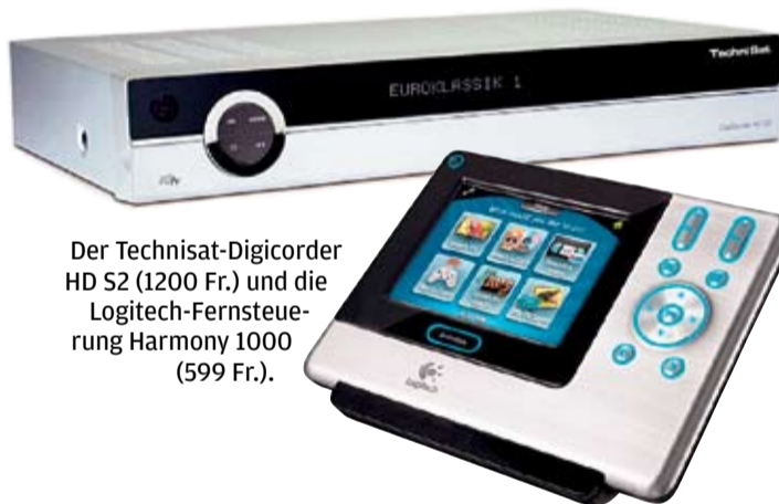
Der Technisat-Digicorder HD S2 (1200 Fr.) und die Logitech-Fernsteuerung Harmony 1000 (599 Fr.).

Da das HDTV-Format ein Speicherfresser ist, sollte genug Platz auf der Festplatte vorhanden sein, wie etwa beim Macro System