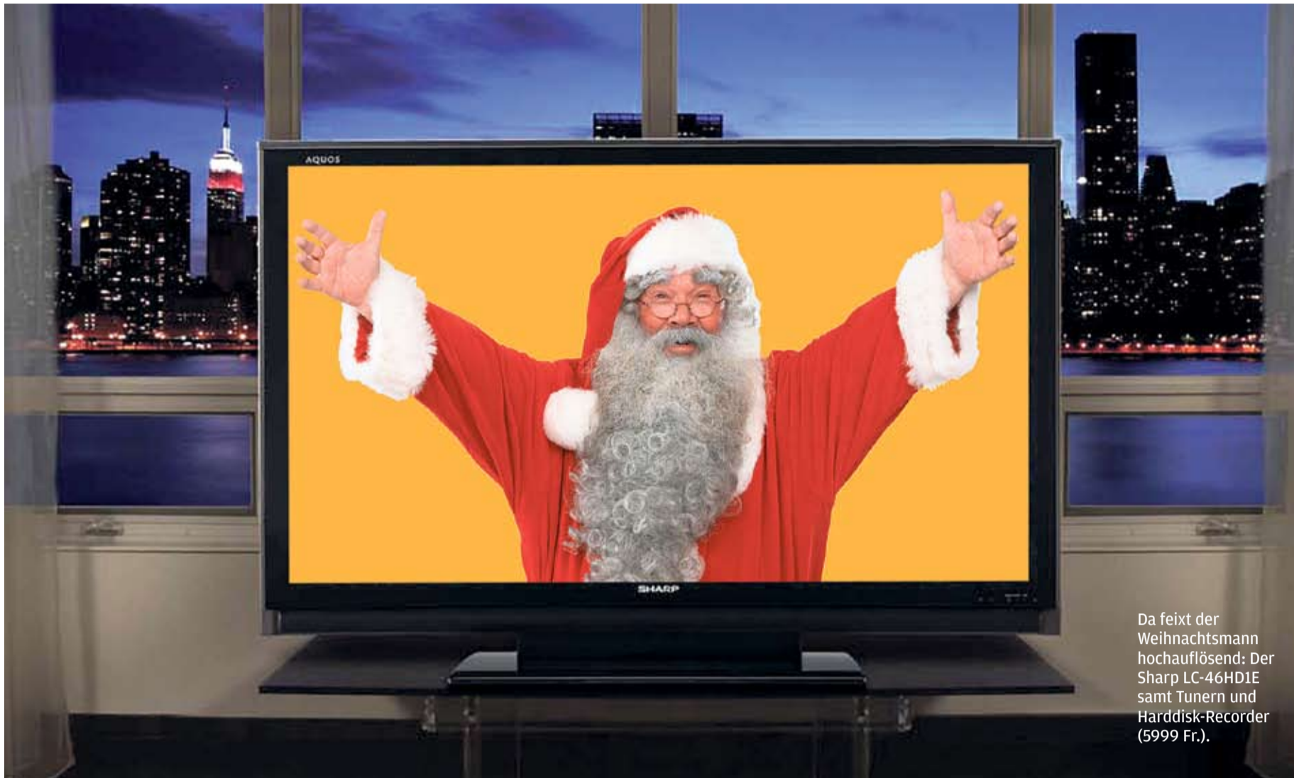
Da feixt der Weihnachtsmann hochauflösend: Der Sharp LC-46HD1E samt Tunern und Harddisk-Recorder (5999 Fr.).